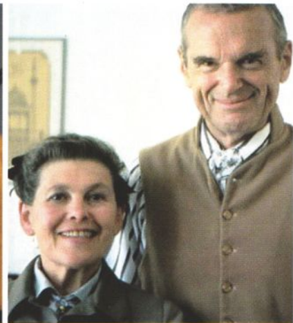
Het designrechtspaar Charles & Ray Eames speelde een centrale rol in naoorlogs design in Amerika en tekende voor veel klassieke ontwerpen.

Dit werd uiteindelijk het begin van het Vitra Design Museum in Weil am Rhein, inmiddels uitgegroeid tot een van de belangrijkste instituten op dit gebied en een absolute must voor liefhebbers van design. Het aankopen van hedendaagse meubelvormgeving staat niet erg hoog op de prioriteitenlijst van Fehlbaum en Mauduit. "Hoewel we blij zijn dat we bijvoorbeeld de 'Lockheed Lounge' van Marc Newson al lang geleden hebben gekocht."